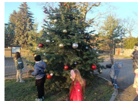
Familien beim Weihnachtsbaumaufstellen an der Reckahner Feuerwehr.

Das Weihnachtsbaumaufstellen fand traditionell auf dem Parkplatz vor dem Gerätehaus statt. Vor 2 Jahren wurde dort ein fester Tannenbaum angepflanzt, welcher bei Kaffee, Kuchen und Glühwein weihnachtlich geschmückt wurde. Ca. 100 Gäste besuchten die Feuerwehr und genossen den gemeinsamen Einklang in die Adventszeit an der warmen Feuerschale.