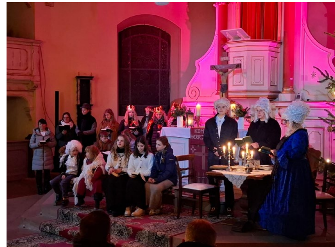
Schauspielerinnen und Schauspieler der „Kraher Dorf Bühne“ beim Krippenspiel „Familie Bach am Heiligen Abend“ in der Kraher Kirche (mit Partnern der Evangelischen Kirchengemeinde Golzow-Planebruch).

Die Anker Zeitung, alle Veranstaltungen und Projekte werden gefördert mit Mitteln des Ministeriums für Wissenschaft, Forschung und Kultur des Landes Brandenburg, dem Landkreis Potsdam-Mittelmark und der Gemeinde Kloster Lehnin.