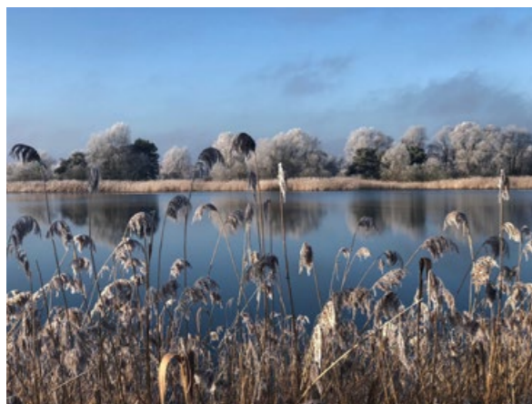
Reckahner Teiche im Januar. Foto: A. Wurg