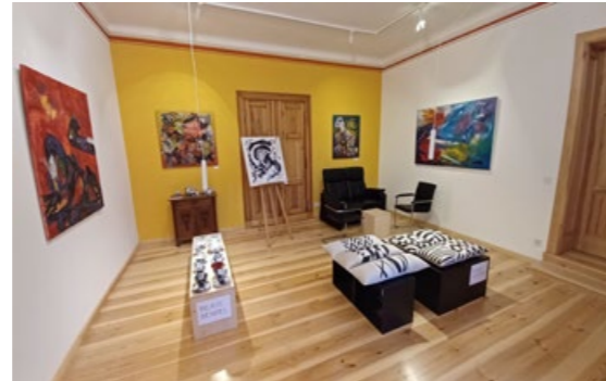
Ausstellungsraum im Kunstgut Krahe mit Werken verschiedener Künstlerinnen.

Das Kunstgut Krahe hatte eine schöne, erfolgreiche Ausstellungs-Premiere von 7 Künstlerinnen erlebt. In der Ausstellung wurden unterschiedliche Kunst-Techniken präsentiert. Die gut besuchte Eröffnung mit Musik fand am Abend des 29.11.2024 statt. Auch wochentags fanden Besucher den Weg zur Weihnachtsausstellung und zahlreiche Kunstwerke wechselten den Eigentümer.