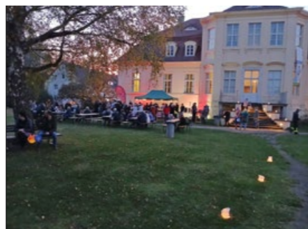
Beleuchtetes Schloss Reckahn und Besucher zu „Feuer & Flamme für unsere Museen“.

Neben einem bunten Unterhaltungsprogramm im beleuchteten und im Kerzenschein schimmernden Schulmuseum mit der märchenhaften Schulstunde zum Thema „Tischlein deck dich!“ wurde im Schloss Reckahn das Märchen „Rapunzel“ durch das Theater RatzFatzPuppen aus Potsdam aufgeführt. Die Feuerwehr Reckahn hatte den gesamten Gutspark mit zusätzlichen Lichterketten und Strahlern beleuchtet, was für eine einzigartige Atmosphäre sorgte. Auch die Bewohner des Ruhesitz Golzow haben 2 Laternen für den Fackelumzug gebastelt, welcher von der Feuerwehr Reckahn durchgeführt wurde.