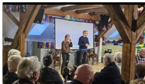
Filmpremiere zur Krahner Kirchengeschichte im Saal des Ritterguts Krahne.