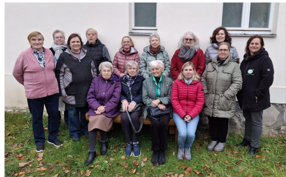
Kreislandfrauen Krahne/Reckahn vor der Landfrauenstube des Gästehauses Reckahn.

Kooperationsprojekte waren bisher die Reckahner Kinderferientage, verschiedene Veranstaltungen des Rochow Kulturensembles Reckahn & des Feuerwehrfördervereins Reckahn, Nistkastenbau mit Bodo Rudolph (NABU RV BRB/Havel) mit den Dorfkids