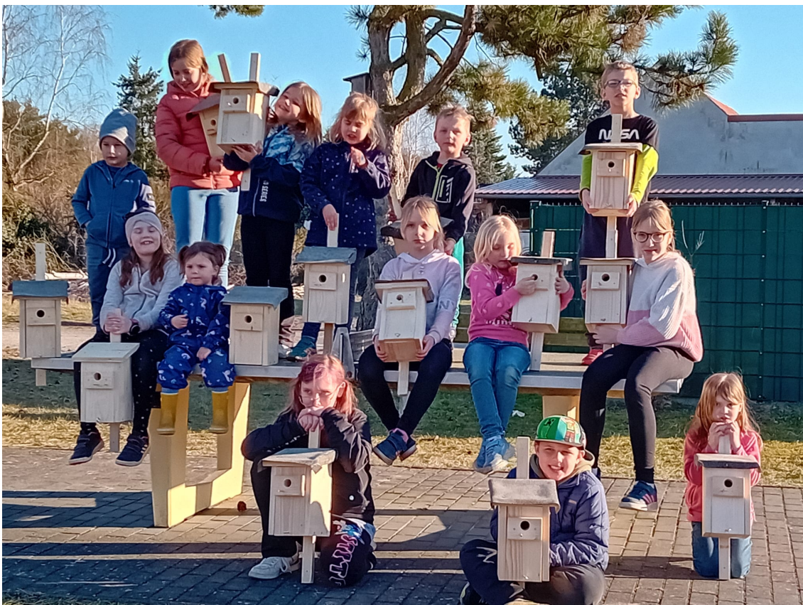
Reckahner Kinder mit ihren selbstgebauten Nistkästen. Ein Kooperationsprojekt der Landfrauen Krahne/Reckahn, des NABU BRB/H. und der Feuerwehr Reckahn.

Die Anker Zeitung, alle Veranstaltungen und Projekte werden gefördert mit Mitteln des Ministeriums für Wissenschaft, Forschung und Kultur des Landes Brandenburg, dem Landkreis Potsdam-Mittelmark und der Gemeinde Kloster Lehnin.