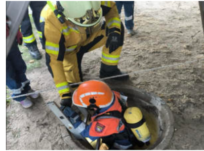
Kind und Feuerwehrmann bei der Übung einer Schachtbergung.

Die Kinder der Jugendfeuerwehr Reckahn verbrachten eine aufregende Übernachtung im Gerätehaus mit mehreren realitätsnahen Übungseinsätzen, darunter technische Hilfeleistungen, Personenrettungen und der Löschung eines nächtlichen Brands. Nach Pizzaessen, Film gucken und einer kurzen Nacht folgte früh am Morgen ein weiterer Einsatz an der Biogasanlage der Agrargenossenschaft "Thomas Müntzer" Krahn e.G. mit Brandbekämpfung und Personensuche. Anschließend frühstückten die Kinder und führten Experimente zu Feuer und Sicherheit durch, bevor sie erneut zu einer verschmutzten Fahrbahn und später zur Reithalle gerufen wurden. Dort retteten sie eine Übungspuppe aus dem Heuboden und bewiesen ihr Können in Erster Hilfe, Knotenkunde oder dem Umgang mit Löscheräten. Zum Abschluss erhielten alle Teilnehmenden die Kinder- bzw. Jugendflamme und kehrten glücklich nach Hause zurück.