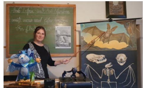
Museumsmitarbeiterin bei der Historischen Schulstunde zum Thema "Die Fledermaus".

Zahlreiche Besucher kamen zum Aktionstag „Feuer und Flamme für unsere Museen“ nach Reckahn. Im Schulmuseum suchten Gäste beim Geländespiel den „Schatz von Reckahn“ und erlebten eine historische Schulstunde zur Fledermaus – von ihren biologischen Merkmalen über ihren Mythos als „Blutsauger“ bis hin zu berühmten Fledermäusen in Film und Fernsehen. Im Rochow-Museum konnten sich die Gäste nach ihrem Rundgang durch die Ausstellung mit Kaffee und Kuchen stärken. Trotz Regen zogen die Kinder abends mit Laternen durch den erleuchteten Gutspark. Für die Lichtinstallationen im Gutspark und der Verpflegung mit Kürbissuppe, Gegrilltem und Getränken sorgten der Feuerwehrförderverein Reckahn e.V. sowie die Landfrauen Krahn/Reckahn.