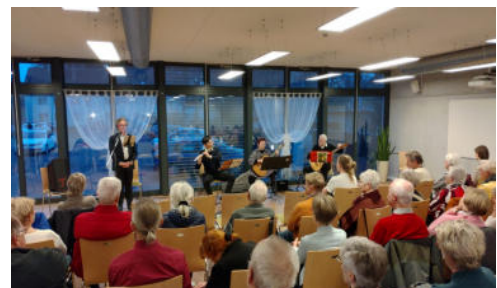
4 Künstler der Havelländischen Musikfestspiele und Zuschauer im Gästehaus Reckahn.

Rund 80 Gäste lauschten dem Erzählkonzert der Havelländischen Musikfestspiele zur Geschichte „Der kleine Prinz“ im Gästehaus Reckahn. Kaffee und Kuchen konnten sowohl im Gästehaus durch die Landfrauen Krahn/Reckahn als auch im Schloss genossen werden. Das Märchen-Thema zog sich auch durch die Reckahner Museen: Im Schulmuseum gab es historische Märchenwandbilder zu bestaunen und im Schloss Reckahn wurde eine rätselhafte Märchenstunde angeboten. Zudem gab es dort einen Bastelstand für die Kinder und vier weitere Stände mit regionalen Spezialitäten, handgefertigter Dekoration und Bekleidung.