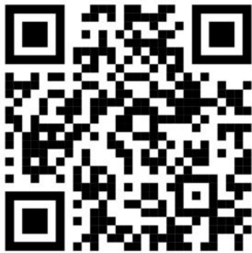
125 Jahre NABU: Besuch beim Regionalverband Brandenburg Havel.