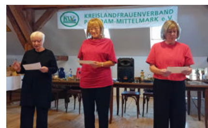
Das "Trio Feminale" im Rittergut Krahne.

Etwa 75 Gäste nahmen an dem unterhaltsamen Kabarettabend mit dem „Trio Feminale“ aus Teltow teil, der von den Landfrauen Krahne/Reckahn organisiert wurde. Die drei Kabarettistinnen analysierten mit weiblichem Scharfblick die politischen Frauen dieser Welt. Mit viel Esprit, Spott und Spielfreude stellten sie ihre eigenen Texte und Lieder zu Themen rund um Politik, Gesellschaft und der Skurrilität des Alltags vor. Die Besucher erlebten ein abwechslungsreiches Programm mit Pointen, die die Lachmuskeln sehr beanspruchten.