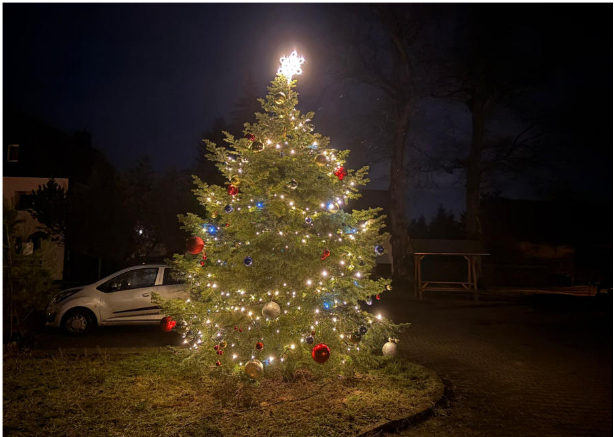
Beleuchteter Weihnachtsbaum vor dem Feuerwehrförderverein Reckahn e.V.

Die Anker Zeitung, alle Veranstaltungen und Projekte werden gefördert mit Mitteln des Ministeriums für Wissenschaft, Forschung und Kultur des Landes Brandenburg, dem Landkreis Potsdam-Mittelmark und der Gemeinde Kloster Lehnin.